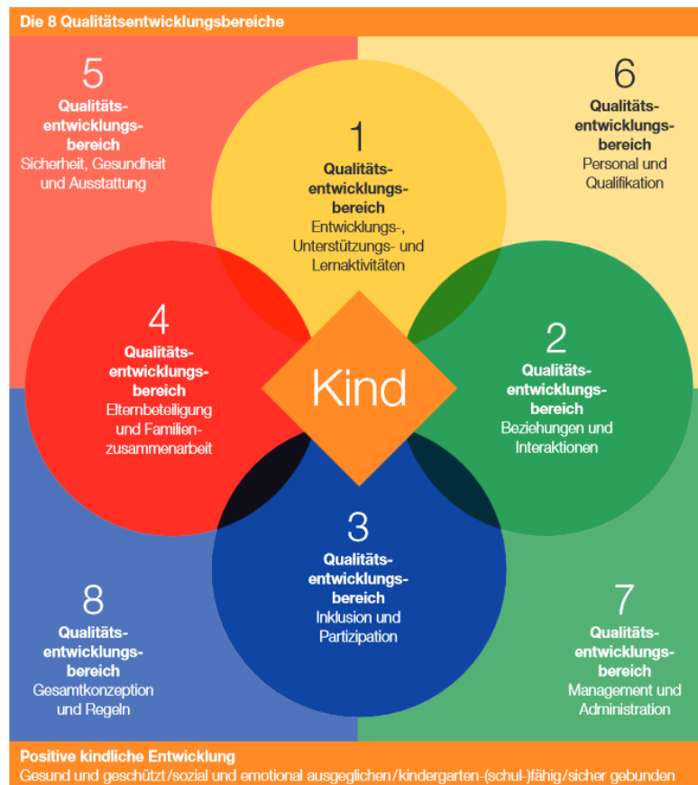
Abbildung 1: Das Modell pädagogischer Qualität von QualiKita

Familienergänzende Kinderbetreuung ist Herzens- und Vertrauenssache. Die Kita Lorenzen wird nach aktuellen fachlichen und betriebswirtschaftlichen Standards geführt und verfügt über ein klares pädagogisches Profil. Die Kita wurde 2015 QualiKita zertifiziert. Der Stiftungsrat hat entschieden per Ende 2018 auf eine Rezertifizierung zu verzichten, jedoch den Betrieb weiterhin gemäss den Prozessen und Qualitätsstandards von QualiKita zu führen. Der Kanton Solothurn (Amt für soziale Sicherheit) überprüft die Qualität-, Sicherheit- und Hygienestandards regelmässig und erteilt die Betriebsbewilligung. Wir sind Mitglied von „Kibesuisse Verband Kinderbetreuung Schweiz, SavoirSocial und dem Verein Kindertagesstätten Solothurn“.